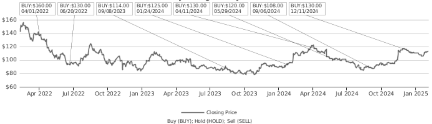
Walt Disney Rating History as of 02/03/2025